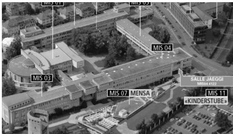
Université Miséricorde, MIS04 4112, Salle Jäggi

Einführungssitzung für neue Philosophiestudierende Mittwoch, 21. September 2016, 17.15 Uhr